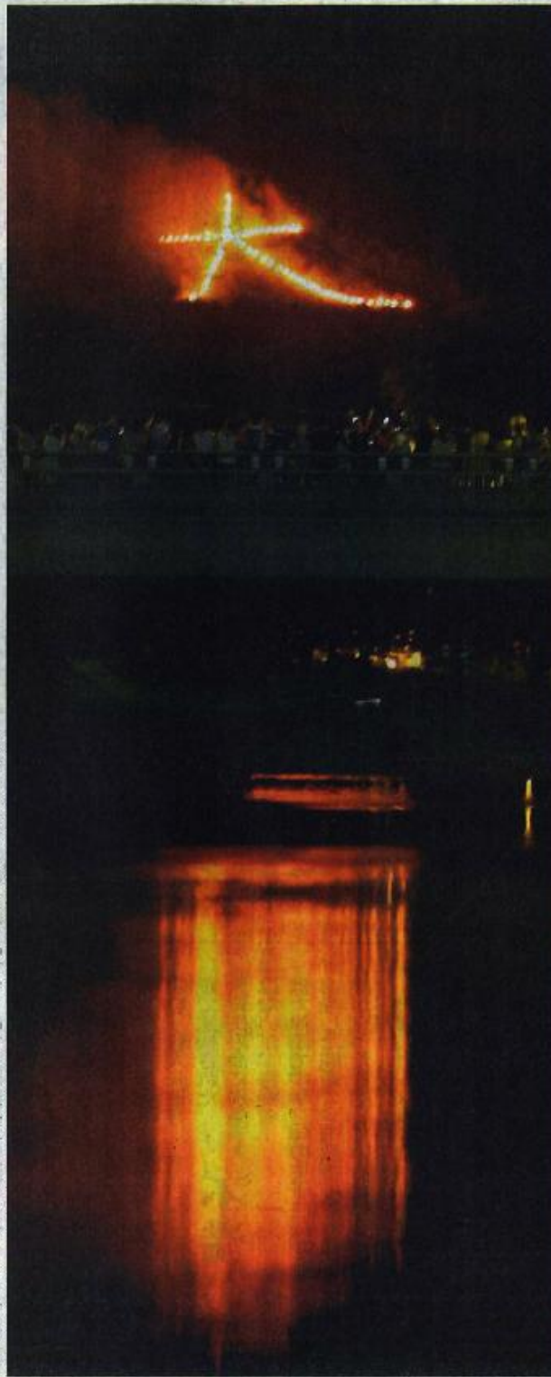
夜空にくっきりと浮かぶ大文字。精霊を送る明かりが鴨川の水面にも広がった16日午後8時5分、京都市北区・鴨川上流、黄茂橋上流、撮影：山本陽平