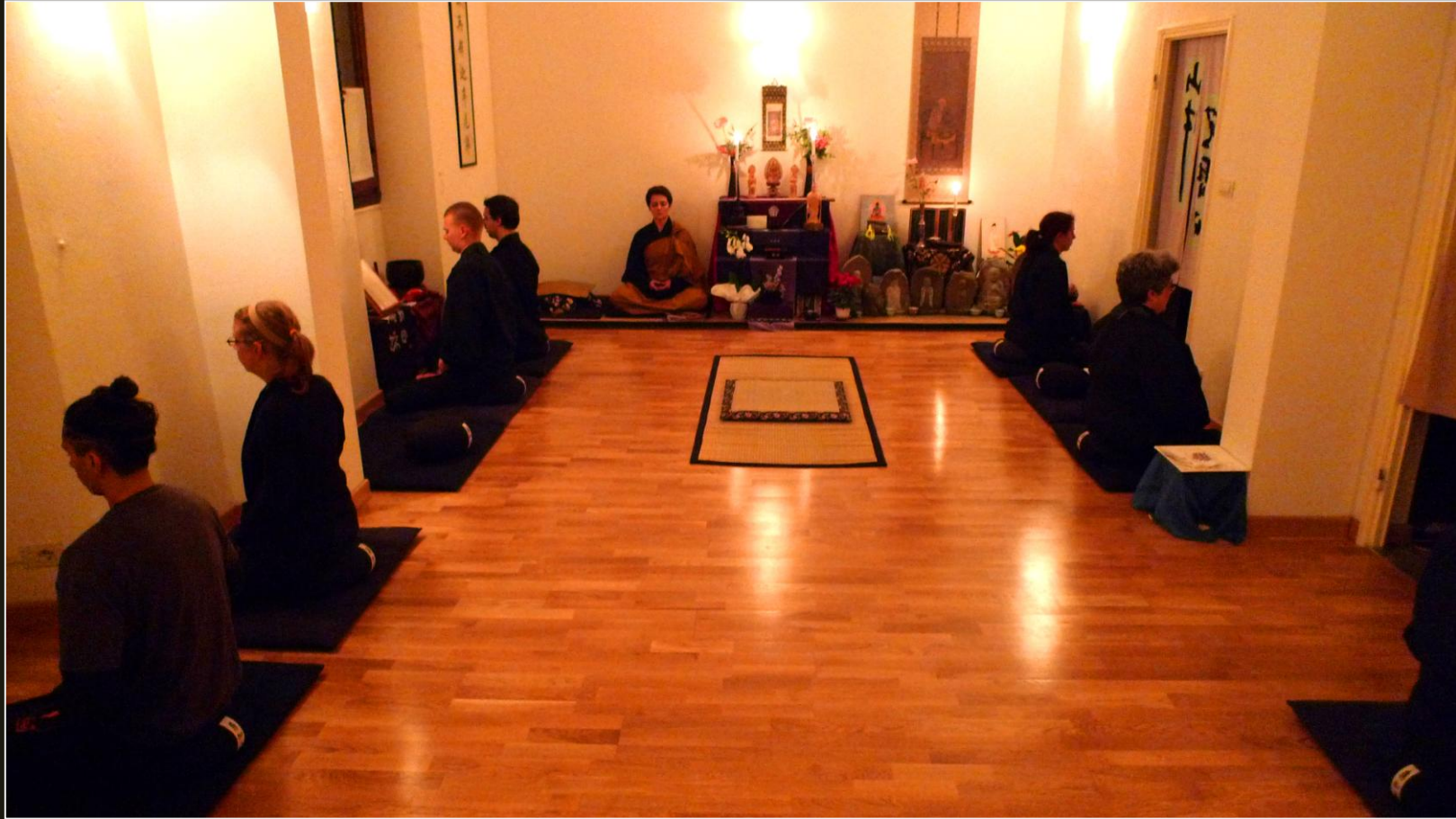
Zazen durante la Veglia di Rohatsu a Shinnyo-ji