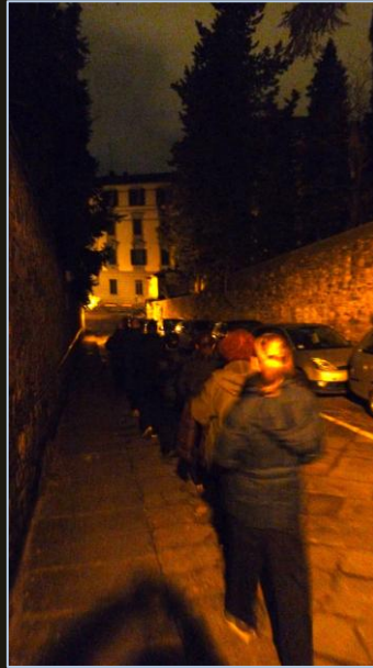
Kin-hin sotto le stelle