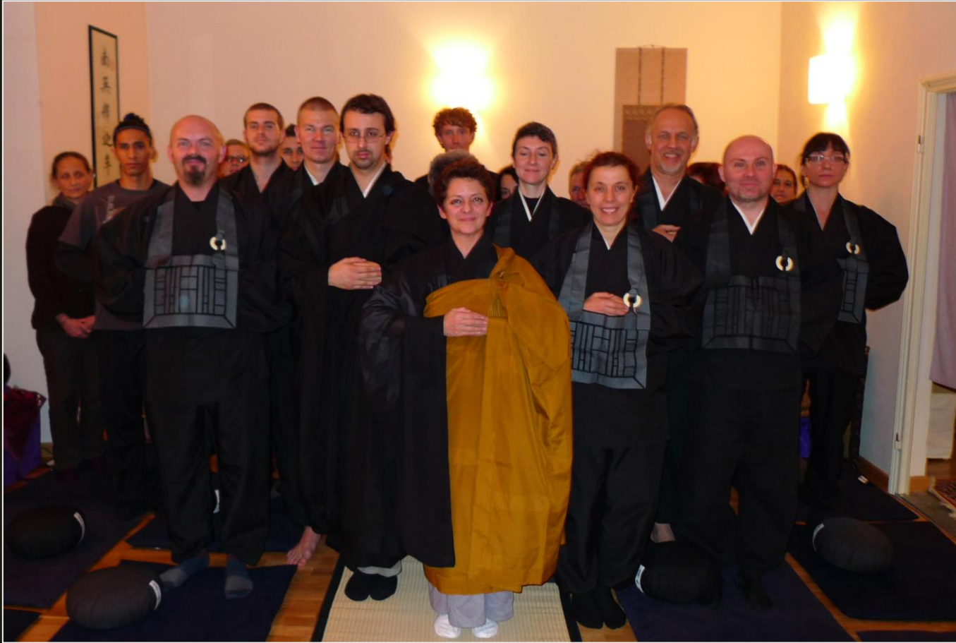
Foto di gruppo durante la Veglia di Rohatsu a Shinnyo-ji