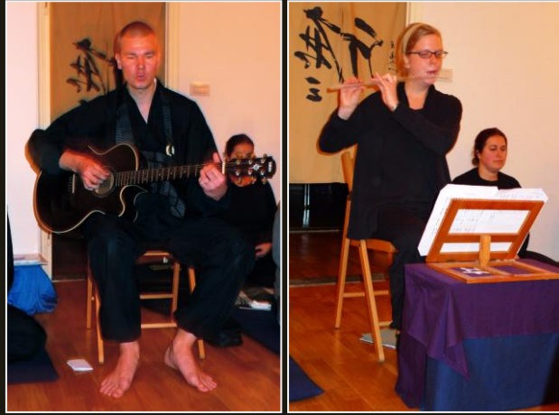
Shin-kō e Lisa durante la loro esibizione musicale

Grazie Maestro Shinnyo per il suo insegnamento. Grazie per il suo sforzo instancabile che permettono a noi tutti di praticare lo Zen. E' un grande dono spero che lo ricordiamo.