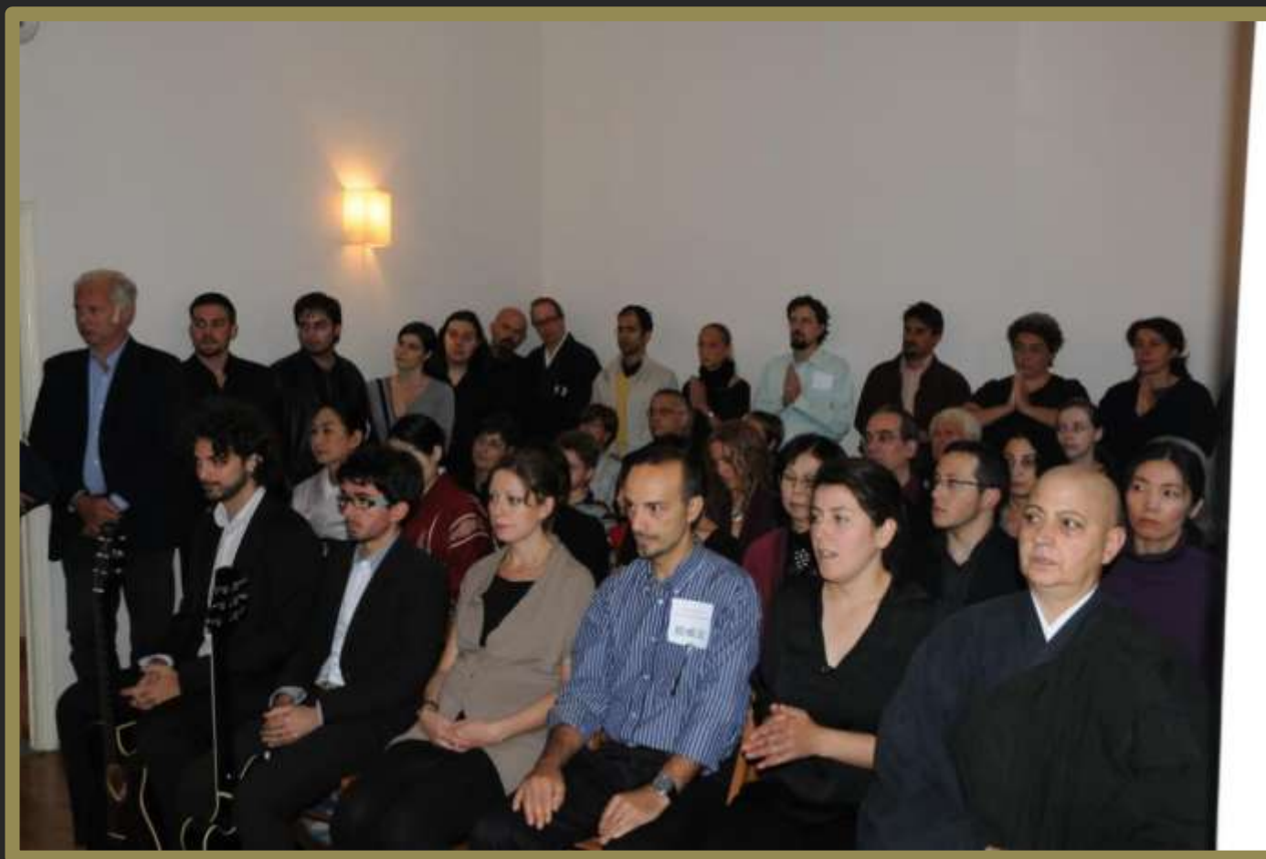
Familiari e amici alla Cerimonia di Jukai.