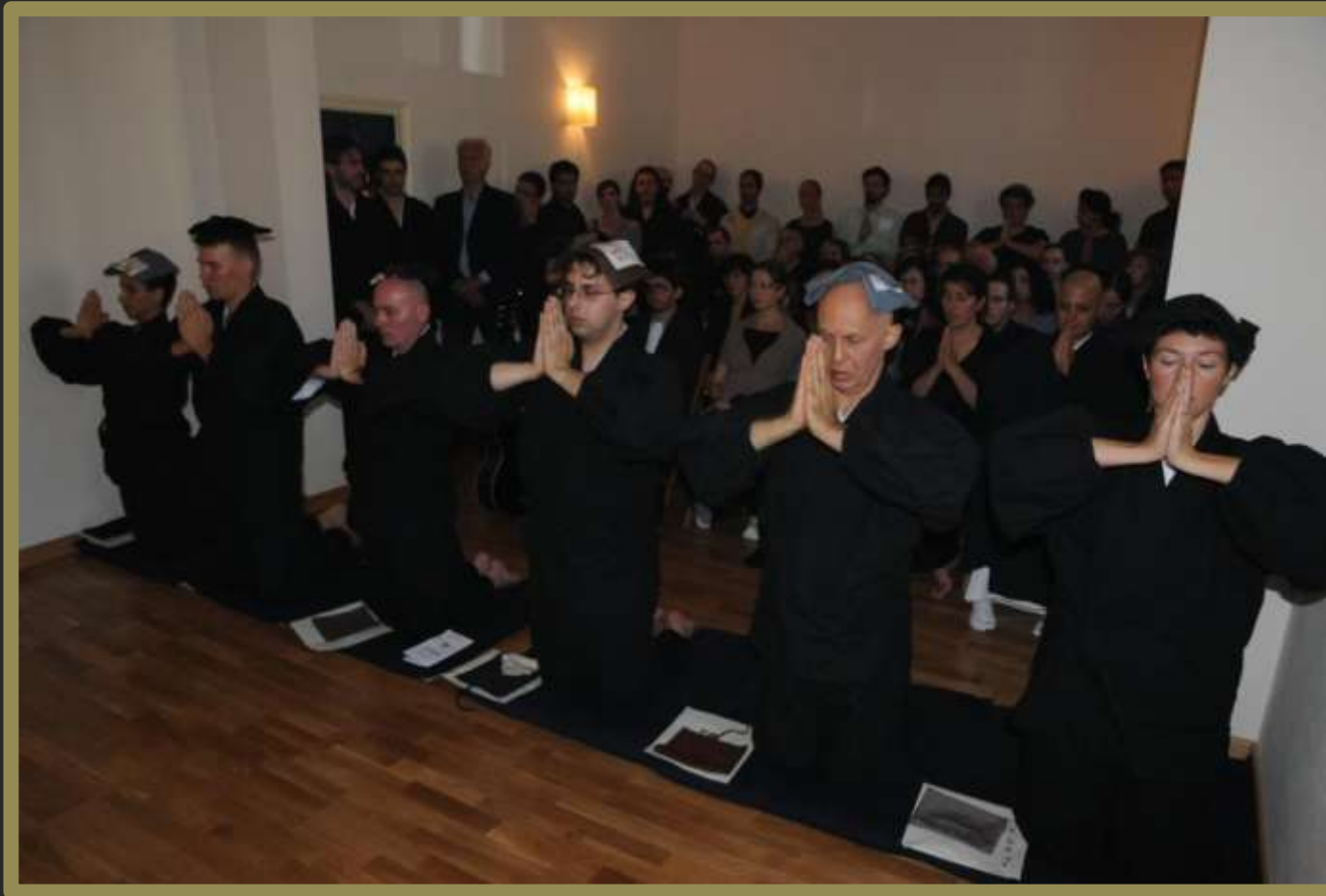
Gli Ordinati recitano il Sutra del Kesa.