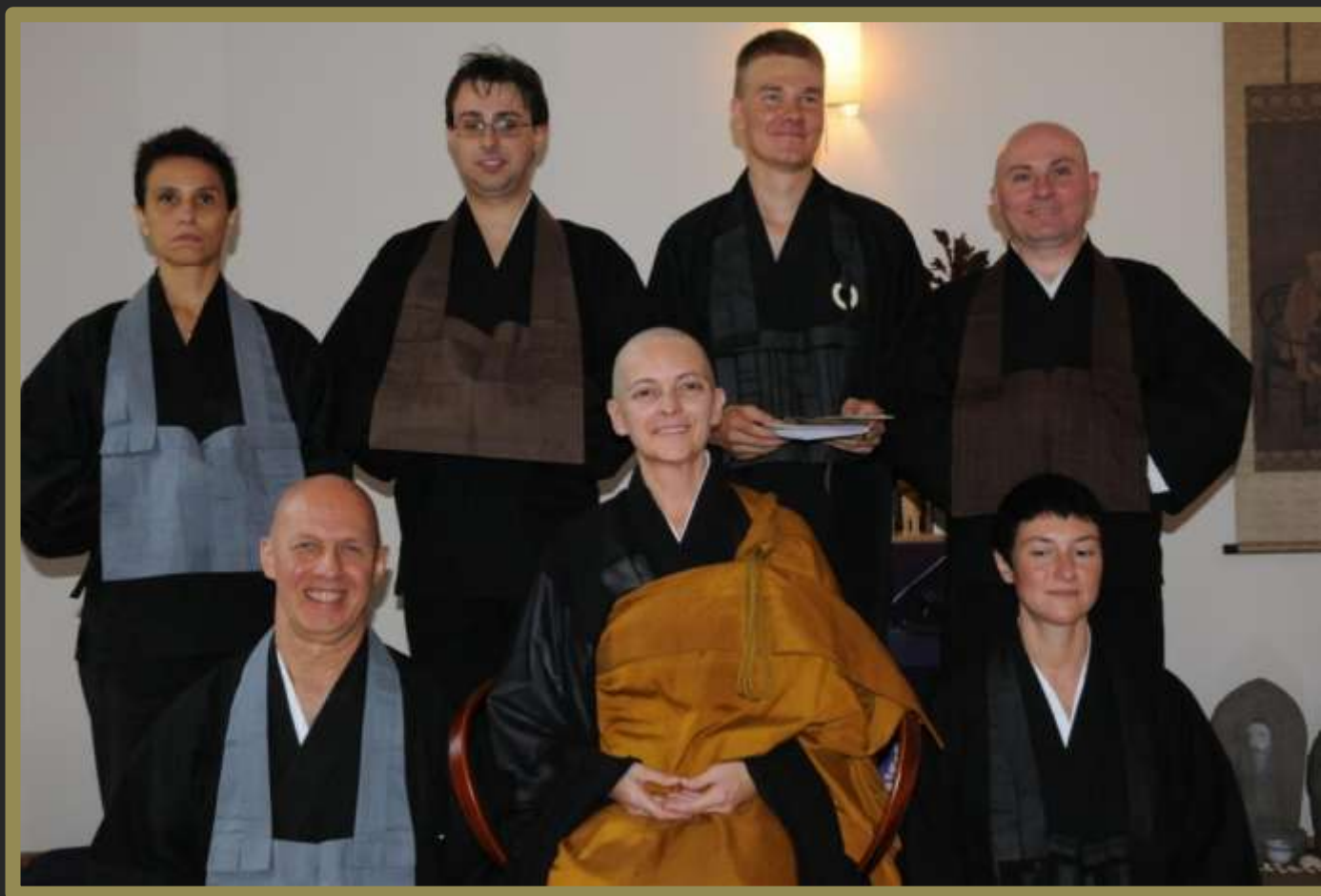
Shinnyo Roshi con i suoi allievi Ordinati.