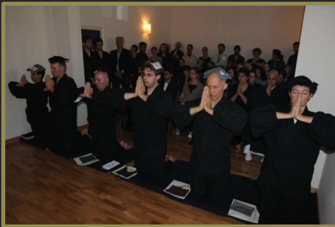
Gli Ordinati recitano il Sutra del Kesa.